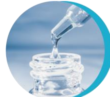
ポリクオタニウム-51