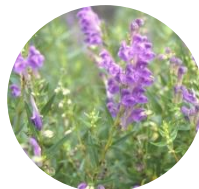
オウゴン根エキス