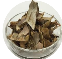
マグワ根皮エキス