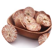
ビンロウ種子エキス