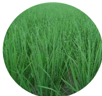
加水分解イネ葉エキス